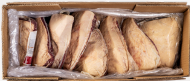
PICANHA SUPER A CONG 1,3KG UP NIREA