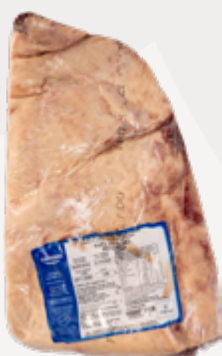
PICANHA A 0,8-1,3KG CONG GUARANI