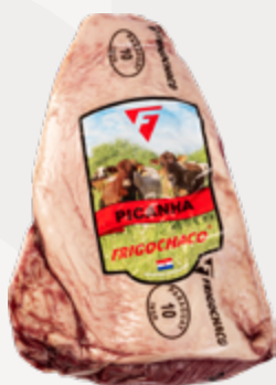
PICANHA A 1-1,3 KG RESF FRIGOCHACO