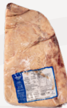
PICANHA A 1,6 KG UP CONG GUARANI