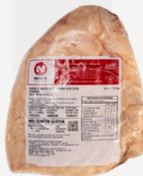
PICANHA A 0,6-1 KG CONG NIREA