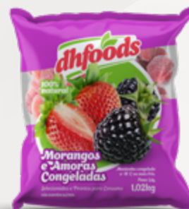
MORANGOS E AMORAS CONGELADOS DHFOODS PACOTE 1,02KG CX 10KG