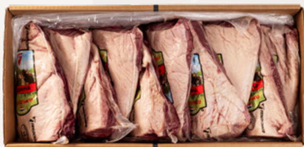
PICANHA A 1,3-1,7 KG RESF FRIGOCHACO