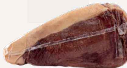
PICANHA A 1,3-1,6 KG CONG GUARANI