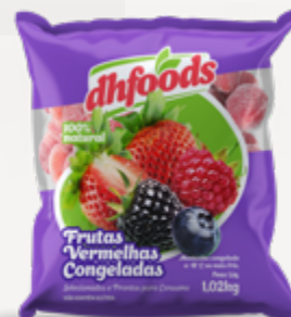
FRUTAS VERMELHAS CONGELADAS DHFOODS PACOTE 1,02KG CX 10KG