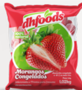
MORANGOS CONGELADOS DHFOODS PACOTE 1,02KG CX 10KG