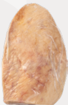
PICANHA SUPER A CONG 0,6-1KG NIREA