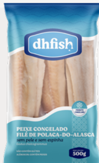
FILE DE POLACA PCT 500G DH FISH CX 10KG