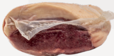
PICANHA SUPER A CONG 1-1,3KG NIREA