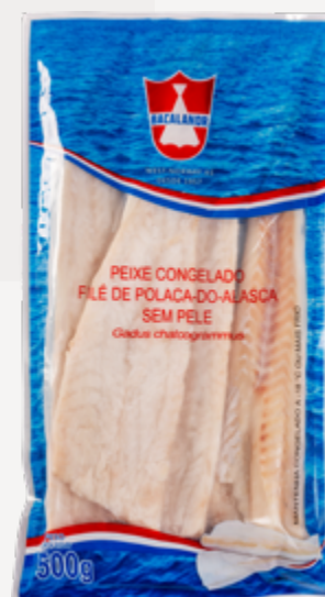
FILE DE POLACA PCT 500G BACALANOR CX 10KG